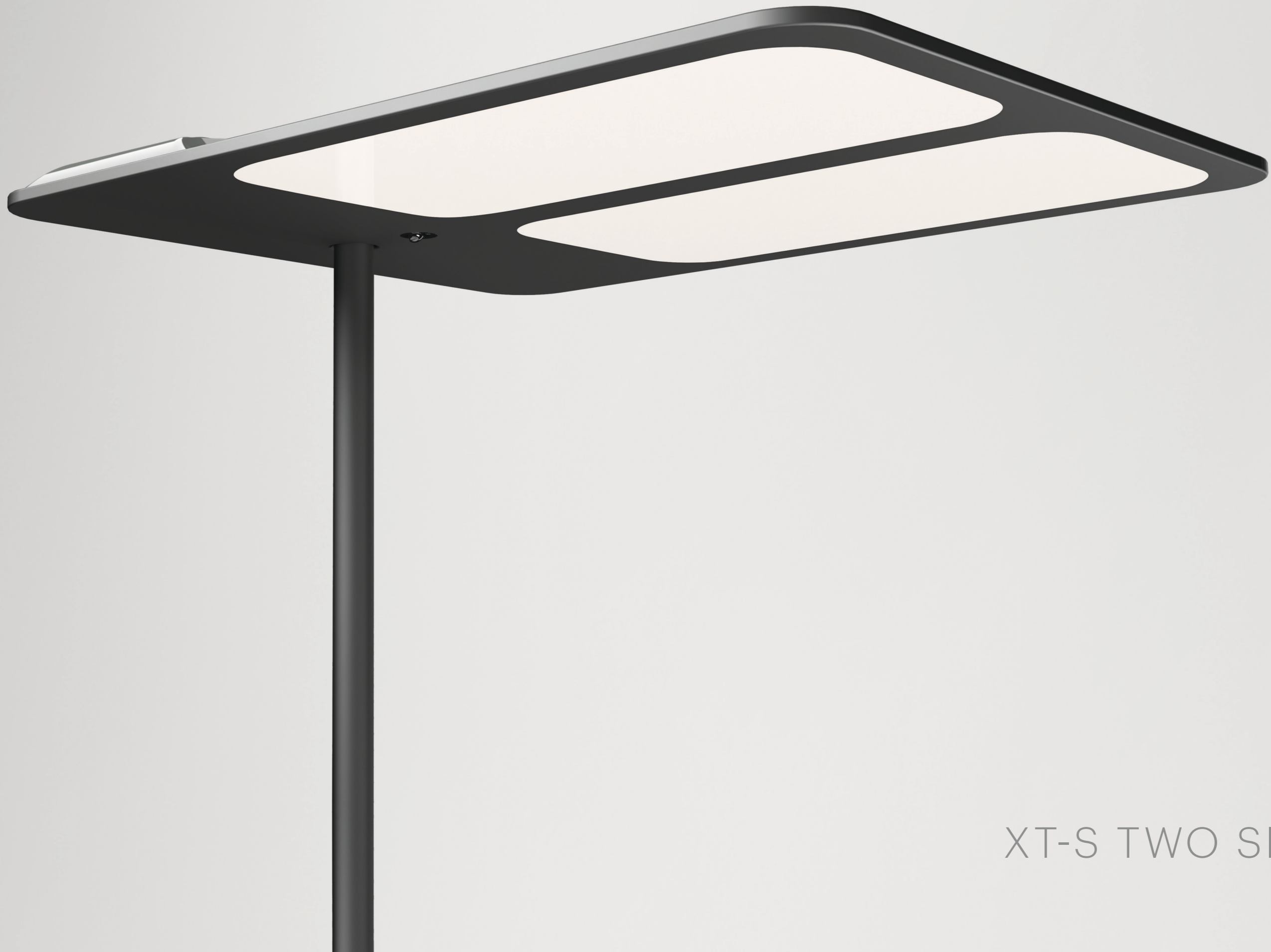
XT-S TWO SIDE